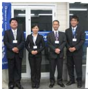
←写真の一番右に写っている人の話