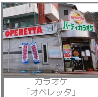
カラオケ 「オペレッタ」