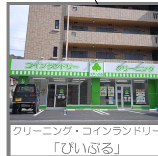
クリーニング・コインランドリー 「ぴいぐる」