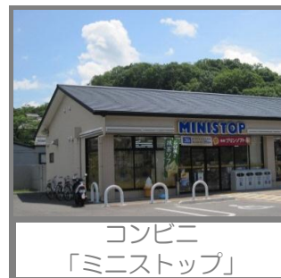
コンビニ 「ミニストップ」