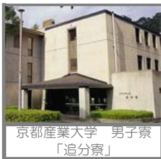
京都産業大学 男子寮 「追分寮」