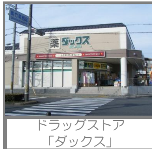
ドラッグストア 「ダックス」