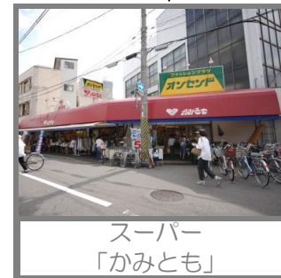
スーパー 「かみとも」