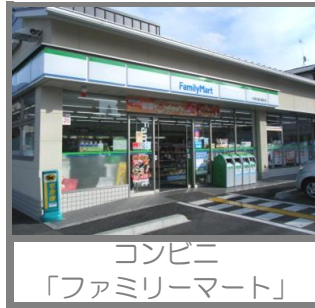
コンビニ 「ファミリーマート」