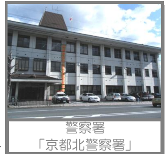
警察署 「京都北警察署」