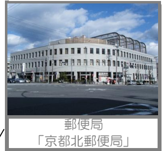
郵便局 「京都北郵便局」