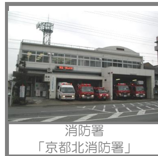
消防署 「京都北消防署」