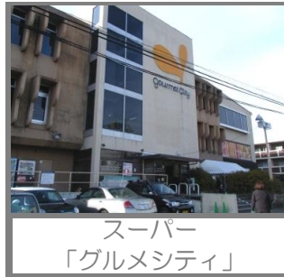
スーパー 「グルメシティ」