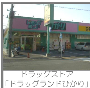
ドラッグストア 「ドラッグランドひかり」