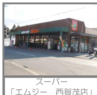
スーパー 「エムジー 西賀茂店」