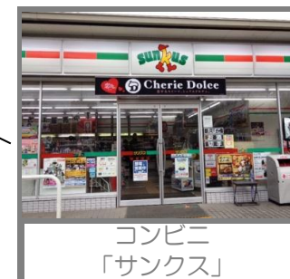
コンビニ 「サンクス」