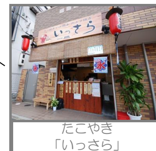
たこやき 「いっさら」