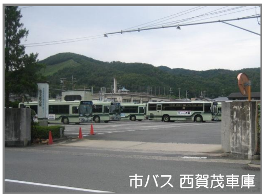
市バス 西賀茂車庫