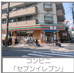
コンビニ 「セブンイレブン」