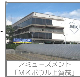
アミューズメント 「MKボウル上賀茂」