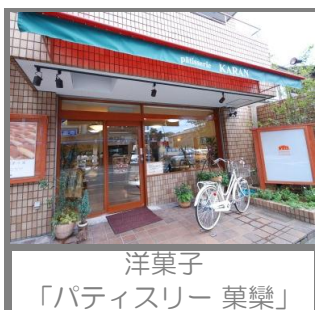
洋菓子 「パティスリー 菓樂」