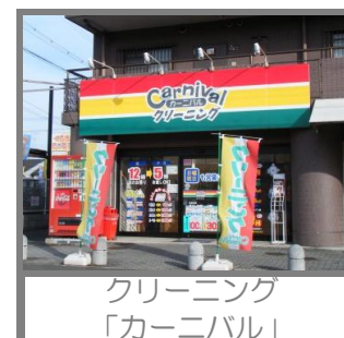
クリーニング 「カーニバル」