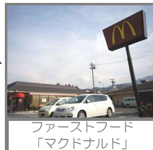
ファーストフード 「マクドナルド」