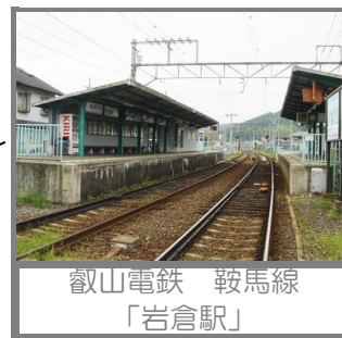
叡山電鉄 鞍馬線 「岩倉駅」