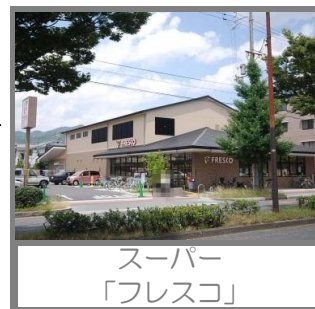
スーパー 「フレスコ」