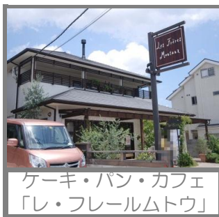
ケーキ・パン・カフェ 「レ・フレールムトウ」