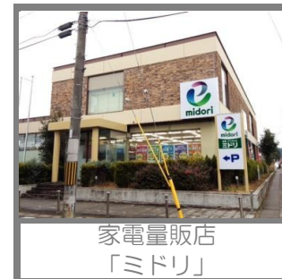
家電量販店 「ミドリ」