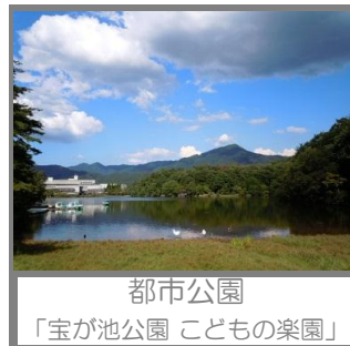
都市公園 「宝が池公園 こどもの楽園」