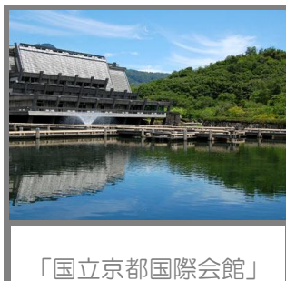
「国立京都国際会館」