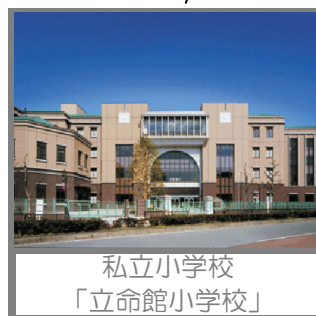
私立小学校 「立命館小学校」