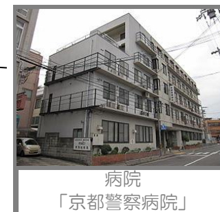
病院 「京都警察病院」