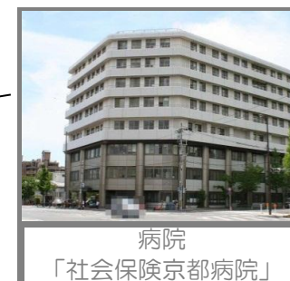
病院 「社会保険京都病院」