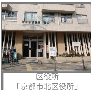
区役所 「京都市北区役所」