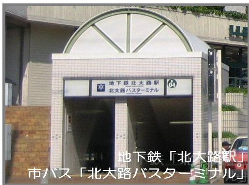
地下鉄「北大路駅」 市バス「北大路バスターミナル」