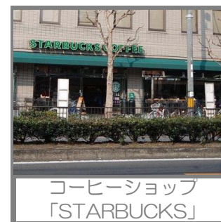
コーヒーショップ 「STARBUCKS」