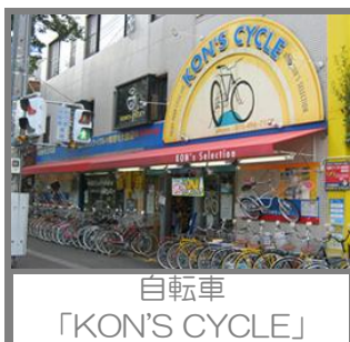
自転車 「KON'S CYCLE」