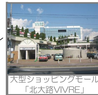
大型ショッピングモール 「北大路VIVRE」