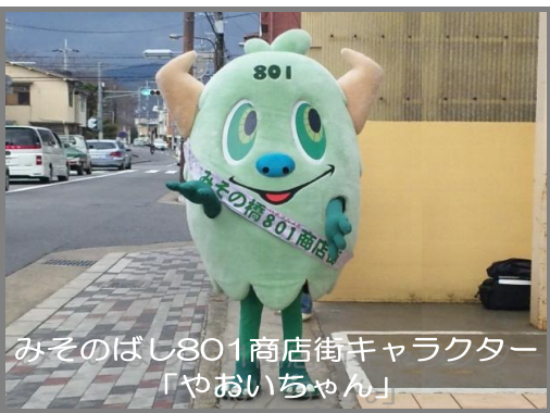
みそのぼし801商店街キャラクター 「やおいちゃん」