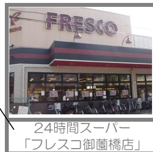
24時間スーパー 「フレスコ御蔭橋店」