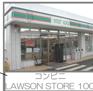
コンビニ LAWSON STORE 100