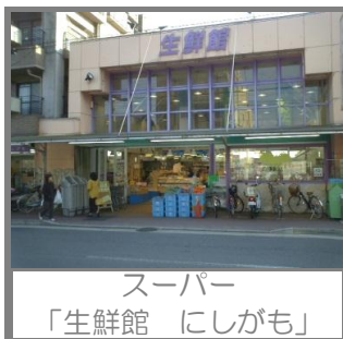
スーパー 「生鮮館 にしがも」