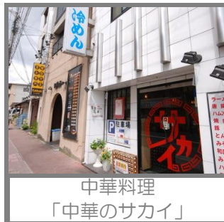
中華料理 「中華のサカイ」