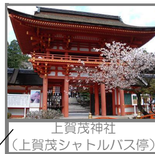
上賀茂神社 (上賀茂シャトルバス停)