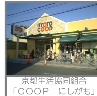
京都生活協同組合 「COOP にしがも」