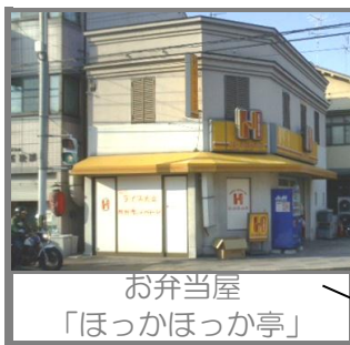
お弁当屋 「ほっかほっか亭」