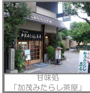
甘味処「加茂みたらし茶屋」