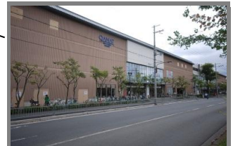
大型ショッピングモール「カナート洛北」