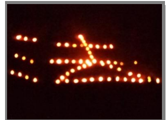
五山の送り火「妙・法」