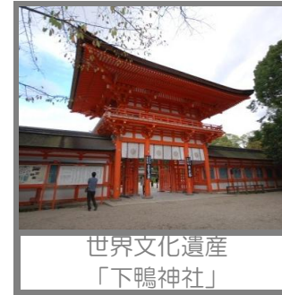
世界文化遺産「下鴨神社」