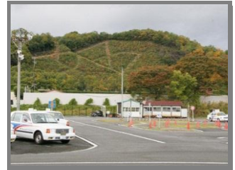
自動車教習所「宝ヶ池自動車教習所」