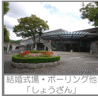
結婚式場・ポーリング他「しょうざん」